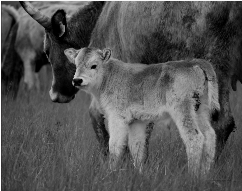
Az egynapos borjú már elkíséri anyját a legelőre